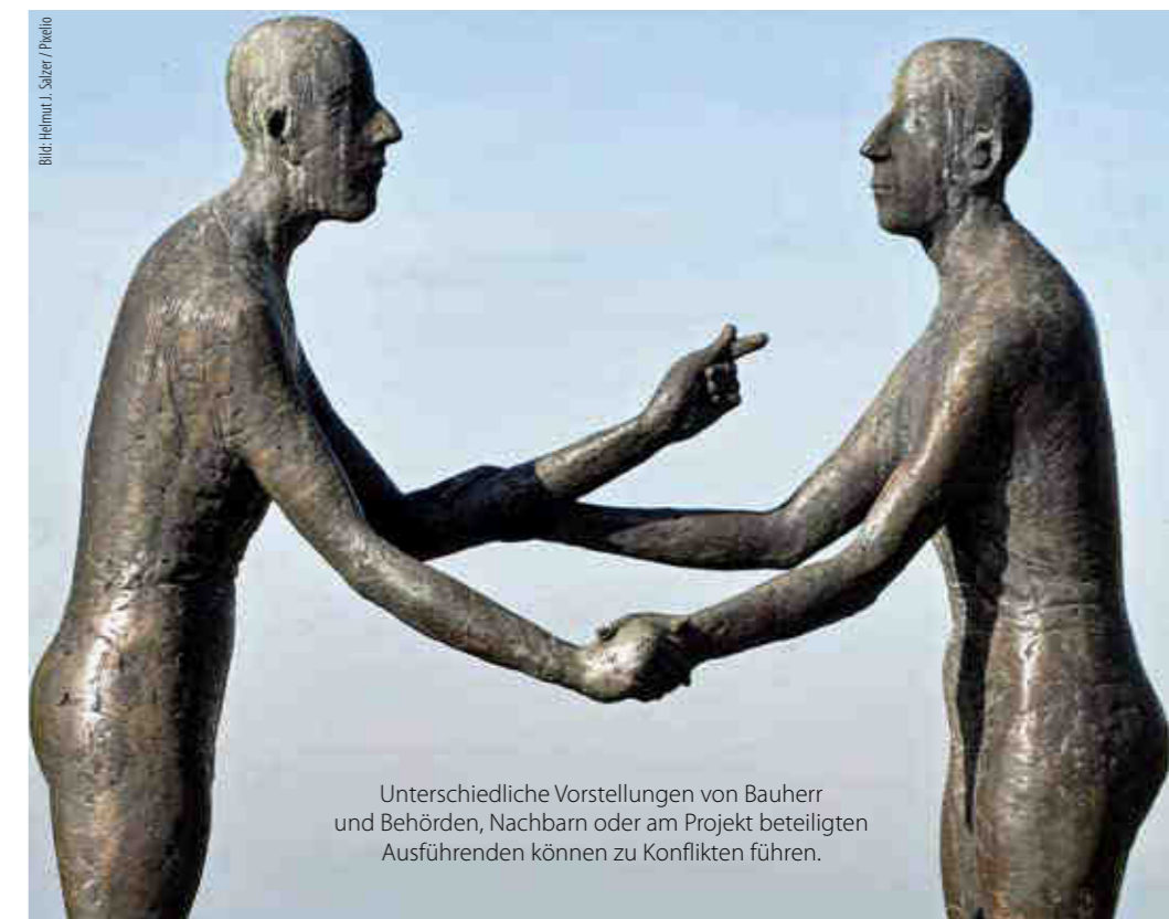
Unterschiedliche Vorstellungen von Bauherr und Behörden, Nachbarn oder am Projekt beteiligten Ausführenden können zu Konflikten führen.

Im Gegensatz zum Neubau kommen bei solchen Bausanierungen noch weitere Personen dazu, nämlich die Mieter. In diesem Fall wird das Urbedürfnis «Wohnen» der Mieter verletzt und viele Menschen können damit nur schlecht umgehen. Für den Investor kann es wesentlich einfacher sein, dass er Kündigungen ausspricht. Sicher ist, ein Grossteil der Mietwohnungen werden im bewohnten Zustand saniert. In diesem Fall ist der eingesetzte Mediator sowohl ein «Störfilter» als auch ein